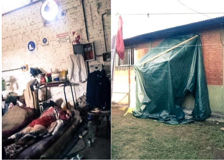
Condiciones del taller de carpintería del UP1, donde los presos positivos fueron aislados.